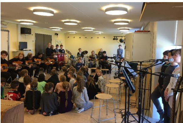
Undervisningen på skolen fortsætter som normalt

Helsinge Realskole er ikke udtaget til strejke. Vi er også blevet friholdt fra lockout, da vi som skole har en specialundervisningsprofil. At have en sådan profil betyder, at vi tager et socialt ansvar ved at inkludere pt. 30 elever med behov for bistand af specialpædagogisk karakter i læringsmiljøet.