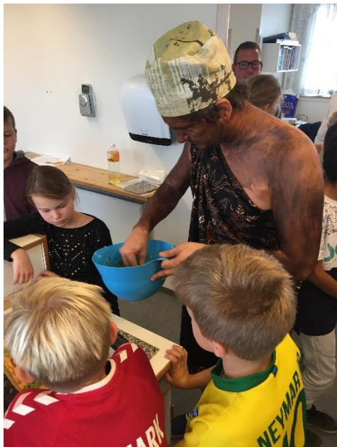
Afrikansk pizza med søde kartofler og mango!

Traditionen tro holder vi emneuge på skolen i uge 41. Skolen summer af liv og masser af anderledes aktiviteter, der bestemt ikke ligner almindelige skoledage. Eleverne oplever og lærer noget andet, end de plejer i emneugen.