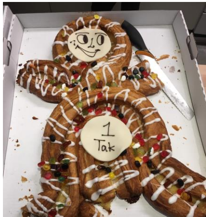
Kvickly fik en bestilling på 57 kagemænd ☺

Helsinge Realskole ligger igen i år som nummer 1 på Cepos' liste over skoler, der løfter eleverne bedst. Det lykkes kun med dygtige medarbejdere og elever, og ikke mindst forældre, der bakker op om skolen. Vi har fejret den flotte placering med kagemænd til alle medarbejdere og elever. Tak til alle!