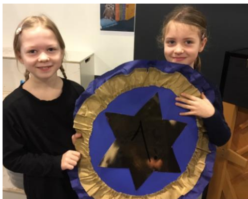
Glade vindere fra 2.2 ...

I januar måned har alle indskolingsklasser været med i en konkurrence om at være bedst til at holde orden i garderober og klasser, så det er nemt for rengøringen at komme til.